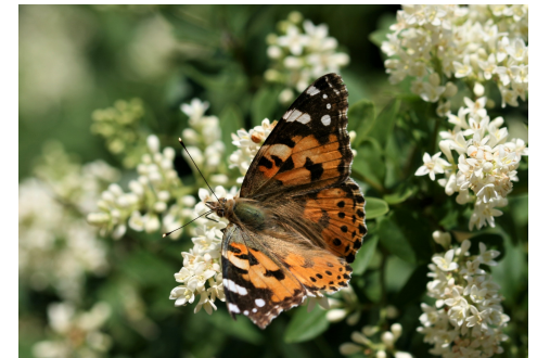
Kleiner Fuchs auf Liguster

Schwarzerle Roter Hartriegel Hasel Weißdorn Pfaffenhütchen Rote Heckenkirsche Traubenkirsche Kreuzdorn Faulbaum Hunds- und Feldrose Salweide Schwarzer Holunder Roter Holunder Vogelbeere (Eberesche) Wolliger Schneeball Gewöhnlicher Schneeball Kornelkirsche Felsenbirne Schlehe